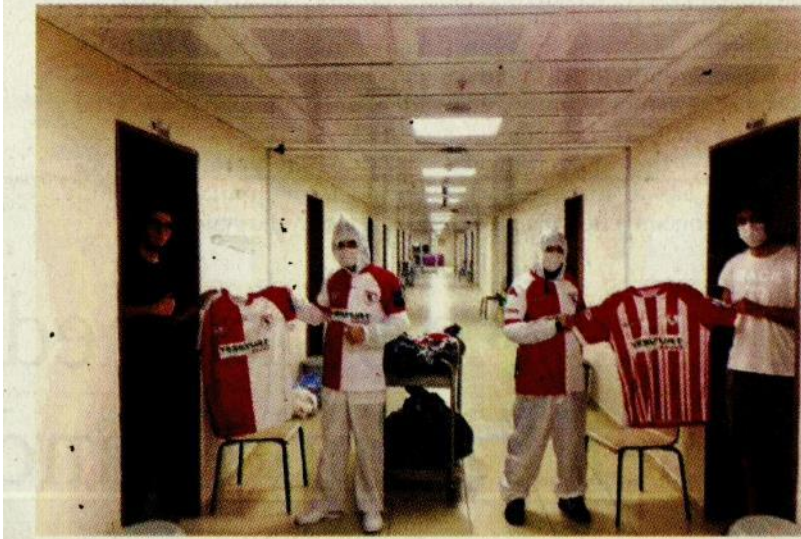
The Samsunspor football team has donated jersey to 40 students, who were put under quarantine in Samsun province after returning to Turkey from Italy.