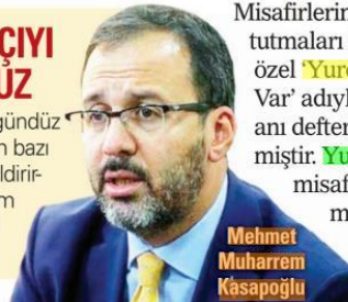
Mehmet Muharrem Kasapoğlu

BAKAN Kasapoğlu, gece gündüz çalışan sağlık çalışanları için bazı yurtları tahsis ettiklerini bildirirken, 47 ilde 73 yurta toplam 3 bin 120 sağlık personelinin misafir ettiklerini kaydetti.