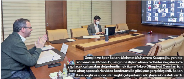
Gençlik ve Spor Bakanı Mehmet Muharrem Kasapoğlu, yeni tip koronavirüs (Kovid-19) salgınına ilişkin alınan tedbirler ve gelecekte yapılacak çalışmalarını değerlendirmek üzere Tokyo Olimpiyat Oyunları için kota almış sporcularla video konferans ile görüşme gerçekleştirdi. Bakan Kasapoğlu ve sporcular sağlık çalışanlarını alkışlayarak destek verdi.

"Bugün öğrencilerimize yuva olan yurtlarımızın, günü geldiğinde milletimizin her bir ferdine yuva olabileceğini görmek de bizim için ayrı bir gurur kaynağı. Türkiye'deki yurt sistemi ve yurt kapasitesi bakımından 2002 yılıyla 2020 yılı kıyaslandığında ayağını bir dönüşüm, adeta bir devrim ortaya konuldu. 2002 Türkiye'sinde yaklaşık 190 bin yatak kapasitesinden bugün 700 bin kişiyi güvenle, aile sıcaklığıyla, her şeyiyle dört dörtlük bir şekilde ağırlamanın sevincini yaşıyoruz. Bu anlamda da bu kritik süreç bizlere yeni bir tecrübe yaşıyor. İnşallah yurtlarımızın 700 bin kişilik kapasitesini, Cumhurbaşkanımızın önderliğinde 1,5 yıl içinde 850 bine çıkaracağız."