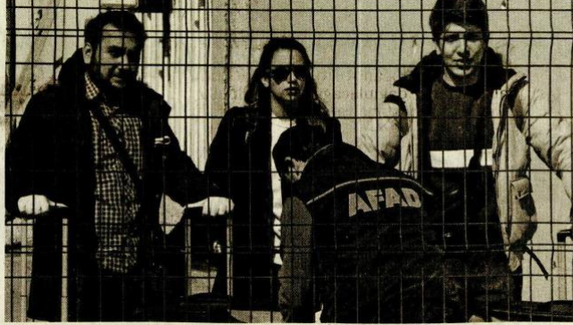
Yeni tip koronavirüs (Kovid-19) tedbirleri kapsamında yurt dışından getirilerek Sakarya ve Bolu'daki yurtlarda gözetim altında tutulan 687 kişi tahliye edildi.

Türkiye'nin, devlet-millet iş birliğiyle koronavirüs belasından kurtul-