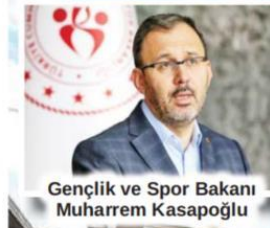
Gençlik ve Spor Bakanı Muharrem Kasapoğlu

"Yurtlarımız yurt dışından gelen 27 bin 595 vatandaşımıza ev sahipliği yaptı. Sağlık çalışanlarımıza ne kadar teşekkür etsek azdır. Onlar, gece gündüz demeden amansız bir mücadele sergiliyor. Sağlık çalışanlarımızın bu takdire şayan mücadelesine bizim de bir nebze katkımız olursa ne mutlu bize. 47 ilde 73 yurttan toplam 3 bin 120 sağlık personeli misafir ediyoruz." ifadelerini kullandı. S.3'te